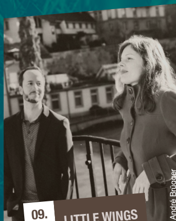
09. 05. LITTLE WINGS

www.wiedemar.ch/duo-niederhauser-wiedemar